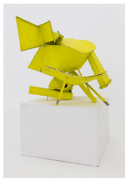
Installationsansicht Sammlung Philara, 2015