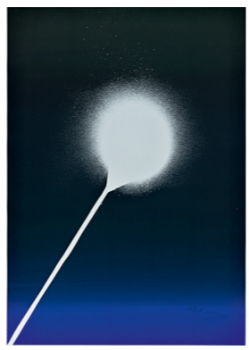
Otto Piene, Apparition White Siebdruck, 1975

Bei Otto Piene begegnen sich Feuer und Licht in immer neuen Bildformen: Regenbögen, Lichtbögen und florale, aus Verbrennungsspuren entwickelte Motive erscheinen bei ihm als leuchtende energetische Ereignisse. Heinz Mack greift verwandte Themen mit anderen Mitteln auf. Seine Arbeiten strukturieren Farbe, Hell-Dunkel und Bewegung in Feldern, Rotationen und Rasterungen. So entstehen Bilder, die unsere Wahrnehmung von Farbe und Licht erkunden. Die gezeigten Blätter stammen aus den 1960er Jahren bis in die Gegenwart und machen sichtbar, wie konsequent beide Künstler das Zusammenspiel von Farbe und Licht über Jahrzehnte hinweg verfolgten.