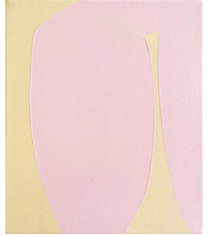
Ohne Titel (über gelb), Acryl und Öl auf Leinwand, 2026