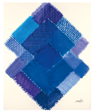
Heinz Mack, Stunde 8 Aus der Serie 72 Stunden Siebdruck, 2016