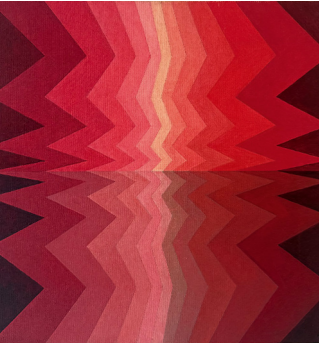
Ohne Titel, Acryl auf Leinwand, 1976

Opitz wurde an der Hochschule für Grafik und Buchkunst in Leipzig ausgebildet; die hier gezeigten Bilder wurden nie ausgestellt. Denken, Lachen, Danken sind drei Begriffe, die er selbst als grundlegende „Haupt- und Lebensbeschäftigungen“ formulierte und die titelgebend für diese Ausstellung seiner sorgfältig konstruierten, farbintensiven Bildwelten sind.