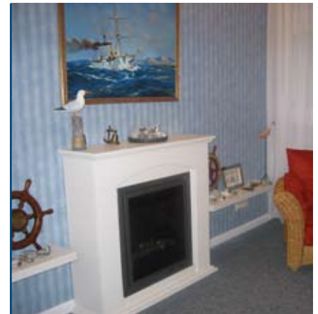
Kaminzimmer „An der Küste“

Wir danken Ihnen für das Vertrauen, das Sie uns entgegen bringen, wünschen Ihnen alles Gute und würden uns freuen, wenn Sie unser Haus weiterempfehlen würden.