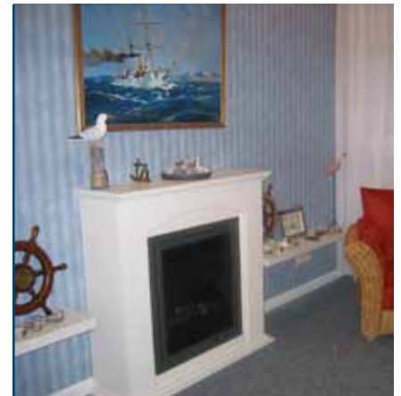
Kaminzimmer „An der Küste“

Wir danken Ihnen für das Vertrauen, das Sie uns entgegen bringen, wünschen Ihnen alles Gute und würden uns freuen, wenn Sie unser Haus weiterempfehlen würden.