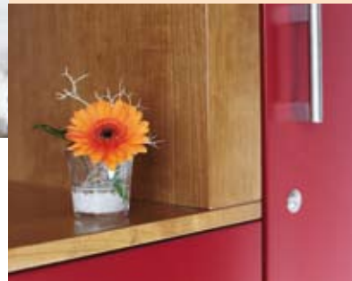
Kühlschrank mit Minibar am Bett, Safe