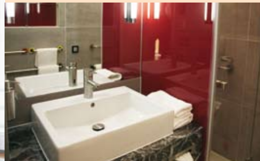
Badezimmer mit Designelementen