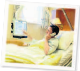
Innovativ: Moderne Technik am Krankenhaus-Bett

Belegklinik mit 40 Ärzten - Moderne Medizin und international zertifizierte Qualität für Kassen- und Privatpatienten