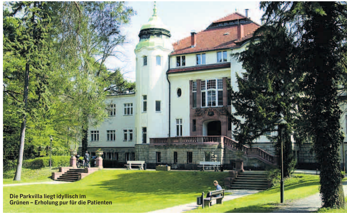
Die Parkvilla liegt idyllisch im Grünen – Erholung pur für die Patienten