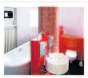
Komfortabel: Badezimmer mit Design-Elementen